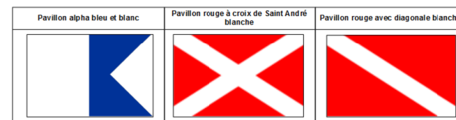
Fig 1 : Pavillons réglementaires